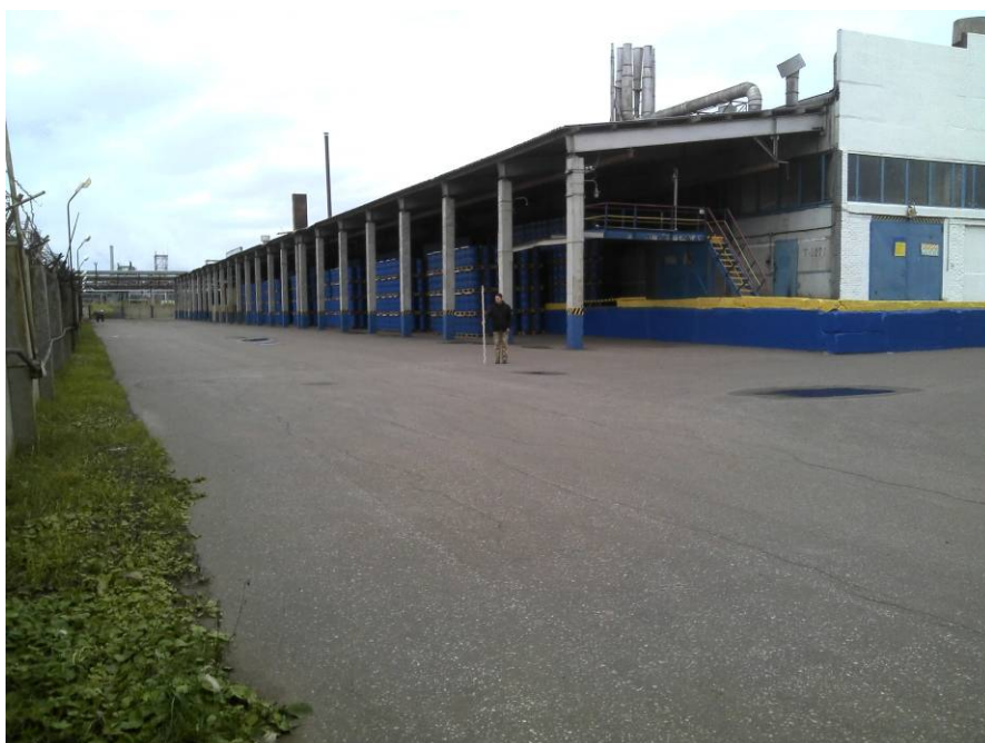
Рис. 5. Осмотр дневной поверхности южного сектора производственной площадки. Вид с юго-запада.