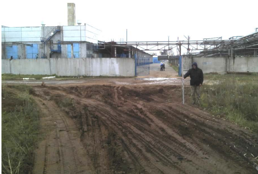
Рис. 3. Осмотр обнажений в непосредственной близости от проектируемой производственной площадки. Вид с севера.