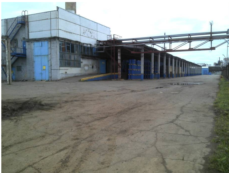
Рис. 6. Общий вид на проектируемую производственную площадку. Вид с северо-запада.