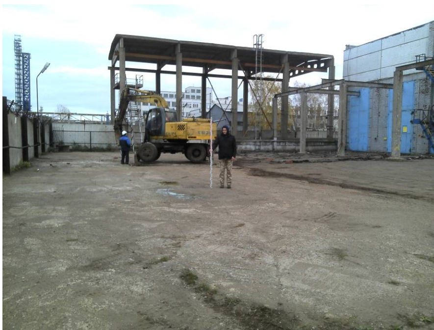
Рис. 4. Осмотр дневной поверхности северного сектора производственной площадки. Вид с запада.